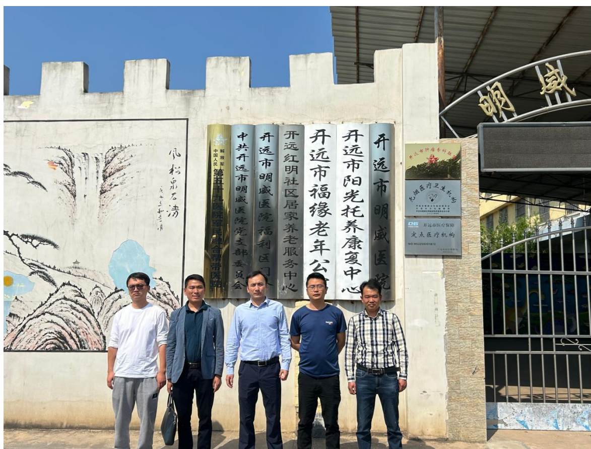
（图：学校党委书记带队访企拓岗）

托特色课堂、基层实践、优秀基层就业毕业生宣讲等形式，扭转学生就业误区，厚植服务基层的职业情怀。二是实施分层分类指导，结合学生年级、专业及发展需求定制就业方案，帮助大家理清职业方向。围绕基层医疗“一专多能”的用人标准，开展政策解读、技能实训、素养提升等培训，全面增强学生岗位适配能力与就业竞争力。三是针对就业困难学生建立动态台账，落实“一人一档、一人一策”，通过结对帮扶、全程辅导等举措，保障重点群体顺利就业。深化政企校联动，主动对接各级卫健部门与基层医疗机构，深挖岗位资源，举办专场招聘与供需对接活动，不断拓宽就业渠道。