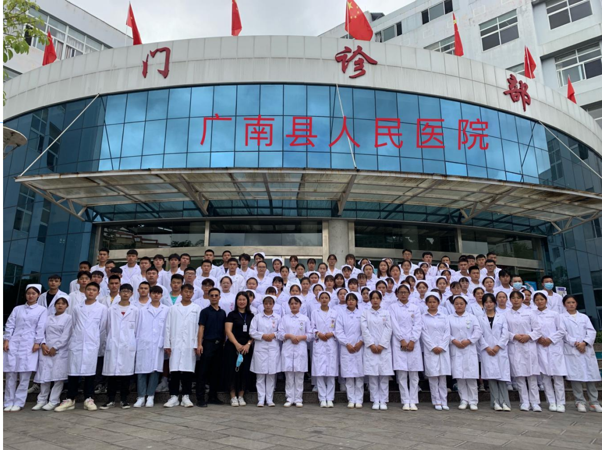
（图：毕业生临床实习）